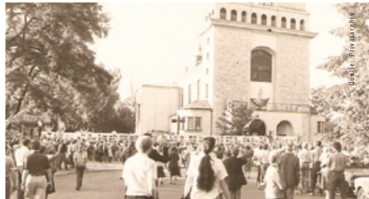
Vor der Kirche des Pfarrers Popiełuszko 1984

Man wusste natürlich nichts Genaues: „Um Popiełuszko gibt es verschiedene Spekulationen. Es sei ein Akt gegen Jaruzelski (von Sondereinheiten des Geheimdienstes veranstaltet). Es handle sich um einen Versuch der Machthaber, die wirkliche Stärke der Solidarność aufzudecken (und natürlich auch ihre geheimen Fäden). Sie wollen zu verfrühter Aktivität provozieren, um dann ihre Preiserhöhungen durchführen zu können. Urban erklärte, Popiełuszko sei gesehen worden, er lebe also. Die Kirche hat am Montag (22.10.) eine recht entschiedene Erklärung abgegeben. Es handle sich um eine politisch motivierte Entfüh-