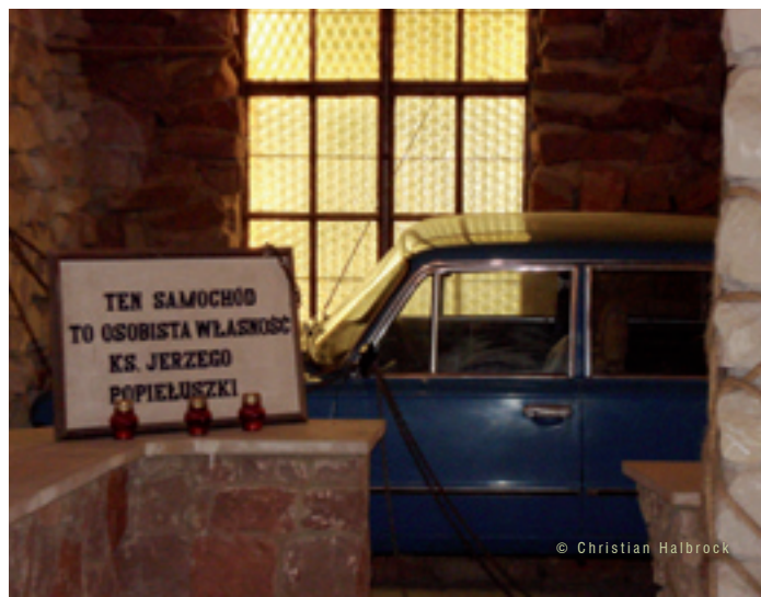
Das Auto von Jerzy Popiełuszko aus dem heraus er entführt wurde

Auch an der Universität dauerten die Proteste an. In der Nacht vom 1. zum 2. November schrieb ich dazu: „Tag für Tag ereignet sich Neues, und ich notiere kaum das Wichtigste auf. Gestern debattierte der Senat fünf Stunden lang. Der Rektor