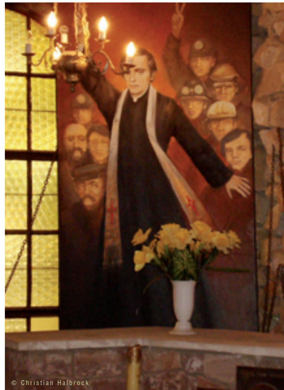
Gedenken an Jerzy Popiełuszko in der polnischen Gedenkstätte Kalów-Godów

„Es waren diesmal viele Schauspieler, die rezitierten, erschienen. Aus dem ganzen Land waren Delegationen gekommen (Wujek, Lubin, Łódź, Katowice etc. wurden genannt). Man betete für Bednarkiewicz, d.h. zum ersten Mal wurde ein Häftling namentlich genannt. Es fehlte natürlich nicht an kämpferischen Liedern. Popiełuszko dankte auch für die Solidarität, was ihm das Ertragen der Verhöre erleichterte. Seine radikalen Messen erschweren sowohl der Regierung wie auch dem Episkopat, einen Kompromiss auszuhandeln. Wenn die Regierung ihn einsperren sollte, müsste die Kirche protestieren, um nicht wie ein Verräter auszusehen; wenn sie ihn nicht einsperrt, droht hier ein »gefährliches Zentrum« zu entstehen. Am liebsten würden ihn beide auf ein Dorf abschieben, aber dazu ist es fast zu spät. – Nach der Messe wurden im Autobus Solidarność-Lieder gesungen. Junge Frauen waren besonders aktiv.“