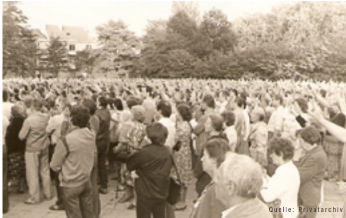
Vor der Kirche des Pfarrers Popieluszko 1984

Marzsalkowska/Aleje Jerozolimskie dankten die Warschauer den Gästen für ihr Kommen, man sang „Boże coś Polska“ und ging auseinander. Auf der Marzsalkowska standen bereits Wasserwerfer und viele Wagen mit Polizisten. Es sah aber nicht so